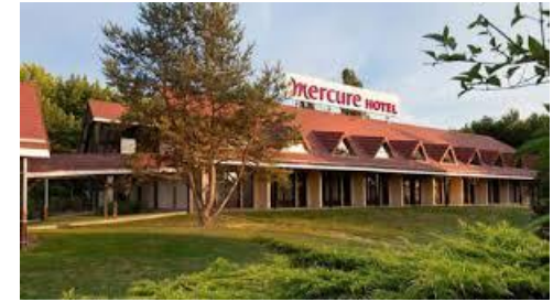
Hôtel Mercure Auxerre Nord Id Chaomois rte Nationale 6 89380 Appoigny 03.86.53.25.00