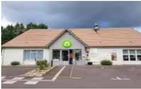
Hôtel restauration Campanile Auxerre Monéteau 7 route athènes 89470 Monéteau 03.86.40.71.11