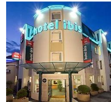
Hôtel ibis centre Auxerre 03.86.48.30.55